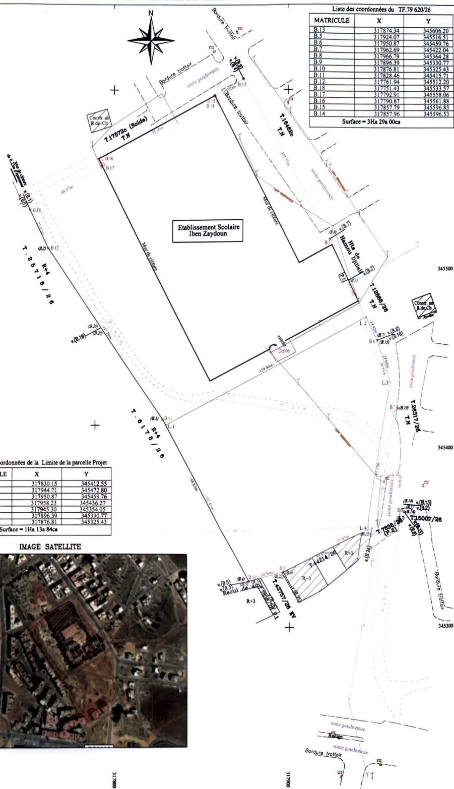
Liste des coordonnées du TF.79 620/26